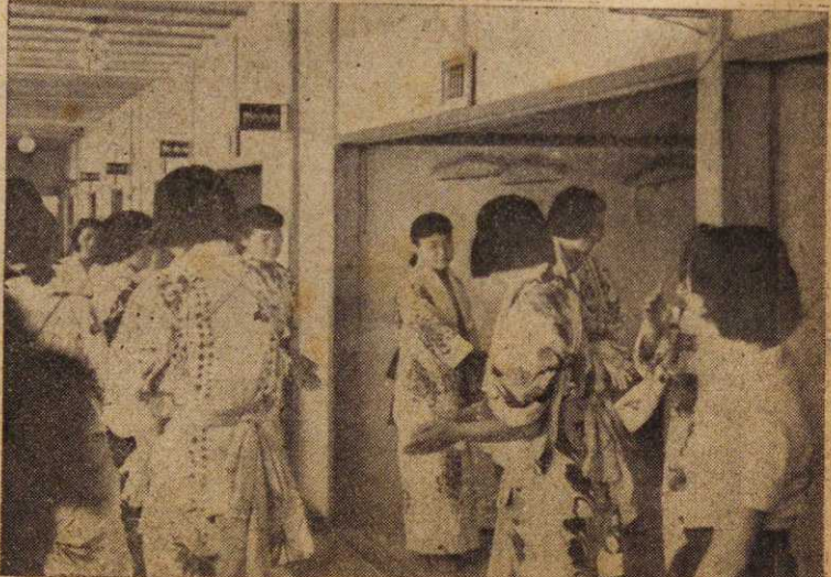
(写真は其日の農養生徒)

ります。若し皆さんが他町村にてたばこを購入され、ば他町村の発展を助ける事になるのです。たばこ消費税は市の重要な財源です。今後皆さんがたばこをお求めの際には、郷土の発展の為、必ず市内のたばこ屋に求められる様お願い致します。