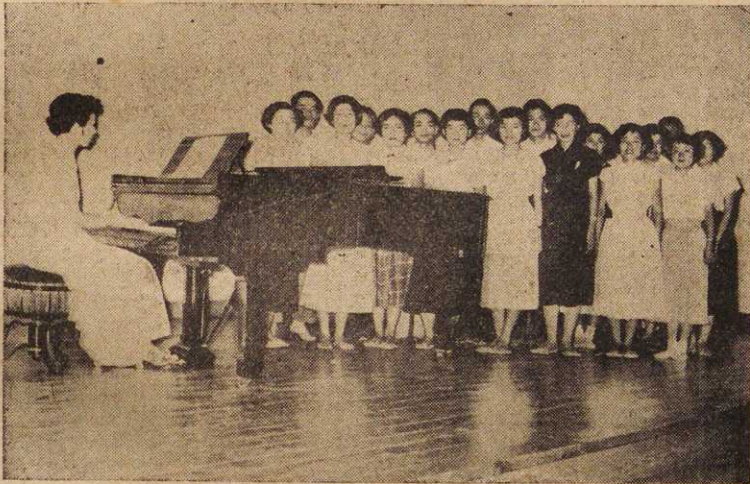
(写真は、音楽発表会に於ける一駒、同好会合唱団の合唱風景)

います。体に少しでも異状がありましたらすぐ医師の診断を受けて、初期の中に発見して万全の処置をとるよう呉々も注意されたいものです。