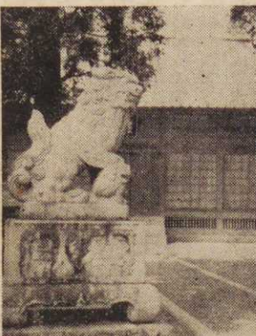
大富村の稲荷神社の石像