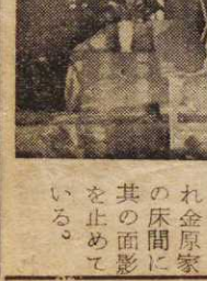
大富村の稲荷神社の石像

余財を蓄へ西国三十三番の観音像を造つて之を残し更に村内の土橋を二ヶ所も石橋に架け替えた。塩のきいた味噌を「弥吉