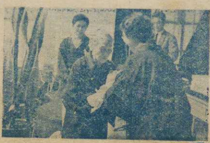
【写真 花束を贈られた老人】