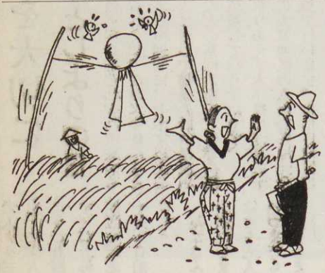
台風シーズンのテルテル坊主 「農協婦人部で考えたテル テル坊主と雀おどしの一 拳前得カカシよ」

在または旅行中の者でも、焼津 市に生活の本拠がある場合は、 焼津市に選挙権がありますから 家族の者が代つて申請して下さい い。なお同居人などでよく名簿 から漏れていることがあります から注意して下さい。