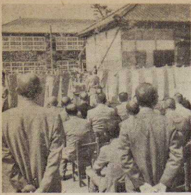
小川小学校の老朽校舎が建直されることになり、さる5月7日起工式が行われました。新校舎は鉄筋3階建て、来年1月に完成する予定です。