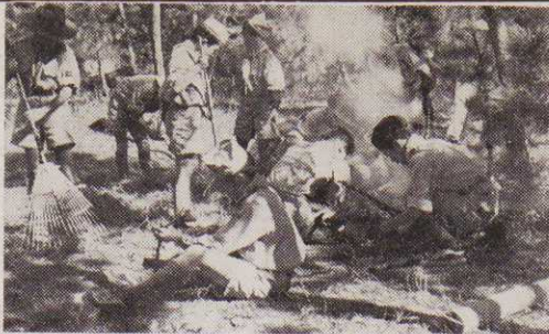
(写真はボーイ・スカウトの隊員たち)

少年期、青年期といわれ、 移つてゆく時代ほど、人間 の基礎をつくる大切な時は ありません。しかもその生 活の大部分をしめる校外生 活のすごしかたにかんによ 強い身体、きょうな技能、他 人への奉仕などこの ような立派な成人と なるよう指導する。 ◎余暇を利用して、 子供の遊びを良い方 に導き、個性教育を 行う機関ですから、 学業のさまたげにな ることはありません。 ◎ボーイ・スカウト の服装をみて「お金 がかる」「びんば うの子供には縁遠 為も多くなりがちです。そ お正月はとかく一般社会 もみだれやすく、このため 青少年の非行を誘発する行 為も多くなりがちです。そ ね。私たちのちよつとの心づかいで港は きれいになるのです。港や川をもう少し いたわつてやりましょう。