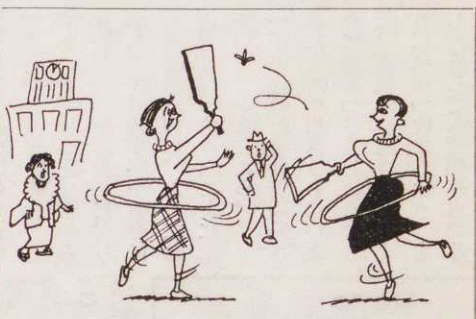
忙しいことデス (正月の遊び-1月中)