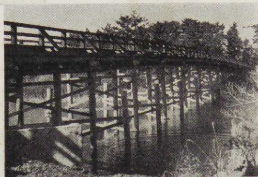
上記の循環道路を横切る栃山川にかかった一色大橋

合併地区を含めた焼津市域全般にわたる道路網を完備し、新旧市域の経済交流はもとより、他中町村との経済交流の橋渡しをする道路が、どうしても必要でした。だが焼津市は、東側が海に面し、北側には山が横たわ