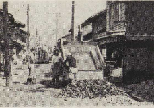
(写真は地がためするための山レキを路に敷く「コマ」)