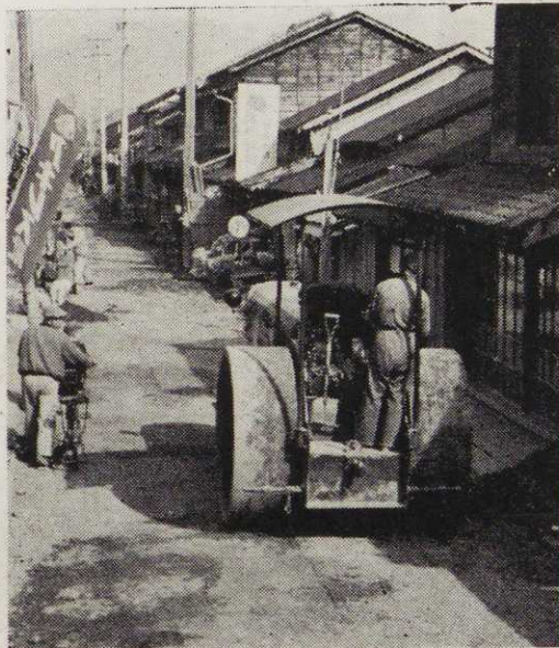
(写真は舗装するためローラーで地がためをしている「コマ」)

頃と予定されており、これからられたり、石をはじかれる心配はこの通りの家々も、泥をはねもなくなったわけです。