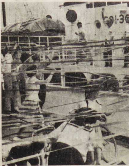
あるところから五年過ぎたある日の出港場面 (福竜丸事件)

かけがえのない人間の生命を奪い、平和な家庭生活をおびやかしていったその事実は、かえようとしてもかわらない。 あのままの事件の日、三月一日は五たびまたやってくるこの日を記念してビキニを忘れるなどの誓い新たに焼津市漁協ホ