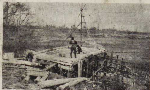
(写真は)大島惣工門線にかか る寄子橋