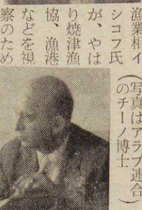
(写真はアラブ連合のチーノ博士)