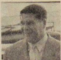
(写真はいしこフ漁業相)

さる八月二十九日にはソ連漁業視察団が、焼津漁協および漁港を視察したが、これとは別にかも同じ八月二十九日、ソ連