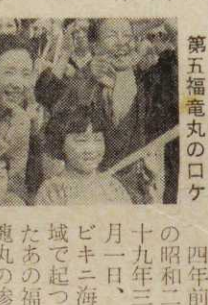
(写真は福丸の出帆見送りシーン)

四年前の昭和二十九年三月一日、ビキニ海域で起つたあの福丸の惨事を映画で再現させ、再び世に問うと現在「第五福