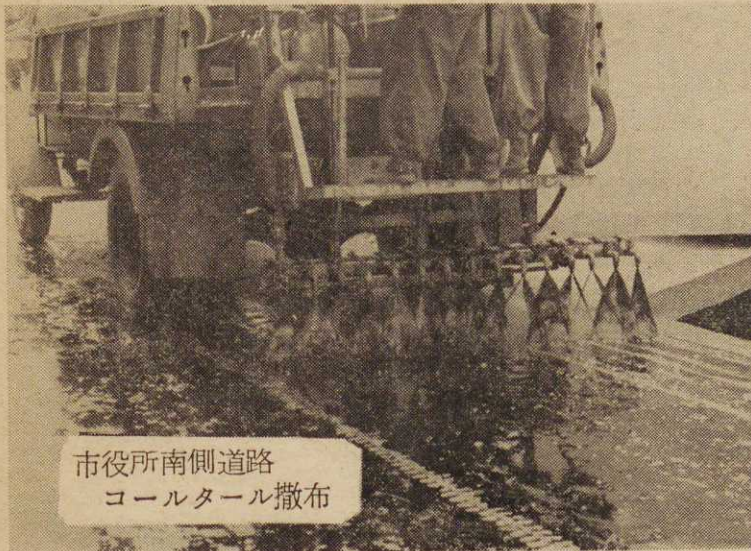
市役所南側道路 コールタール撒布

市内の道路の中で、舗装されてい る道路は総延長の僅か二%で大部分は、デコボコの砂利道路であります。この現状より砂利道路を完 全舗装することは、市の財政上最も困難なことであります どうかといつてそのままにし