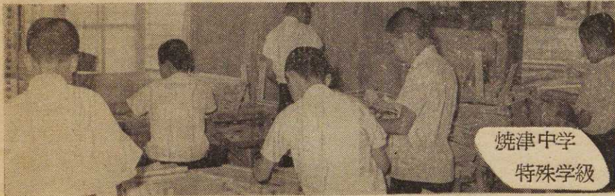
焼津中学 特殊学級

市内の特殊教育に深い関心をお寄せくださった方々の努力で昨年九月十五日に「焼津市手をつなぐ親の会」が創立されました。知恵おくれのこどもさんを持つおかあさんや、これらのこどもに理解をもつ人たちが作ったもので、同じなやみや、不幸な子ども