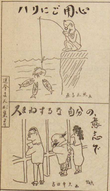
選挙まんが集より

補充選挙人名簿の登録申請期間中に「選挙人名簿」を閲覧させますから、自分が名簿にのっているか確認いたしました。