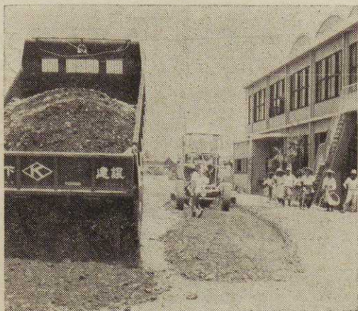
市では市内の道路の補修をしています。みんなの道路を大事にしましょう

ハ、青少年を事故(交通事故、水難事故、その他の事故)から守ることを主題としたもの。【応募資格】一般の部：イ、市内に住所を有する者(年令は不問)ロ、市内に勤務する者(年令不問)勤務先の名称、住所を明記のこと。小中学生の部：市内小中学生