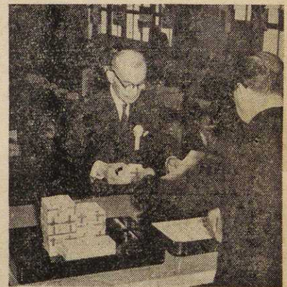
写真・記念式典の模様(上下)