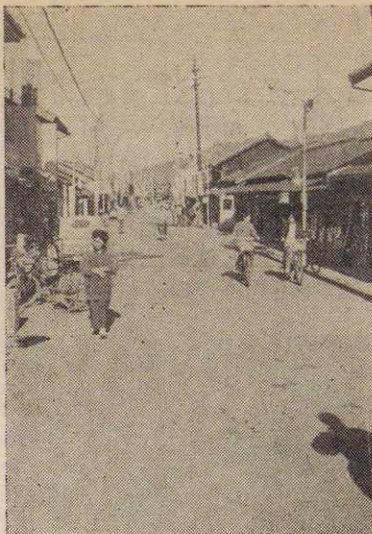
西町通り新装される

こんどの国会には国民年金改正法案、国民年金と他の年金制度との期間の通算をきめる通算年金通則法案等が提出され四月一日にさかのぼり適用される。