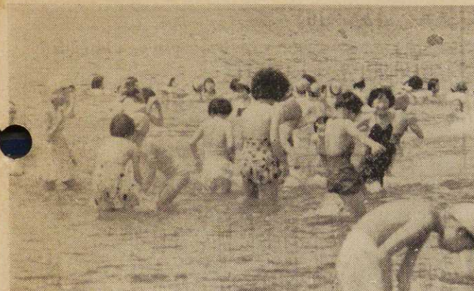
写真は乙女ヶ丘海水浴場

絡してもらいます。従って学校から許可の連絡のある以前と九月一日以降は児童生徒は随意に泳ぐことは許されませんので、間違いないようにしてください。