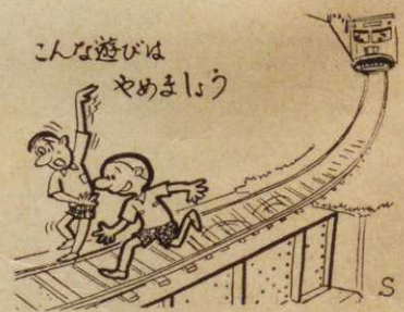
こんな遊びはやめましょう

「社会を明るくする運動」に市民のみならず強力な協力をお願いして今年の夏も犯罪のない明るい街にいたしましょう