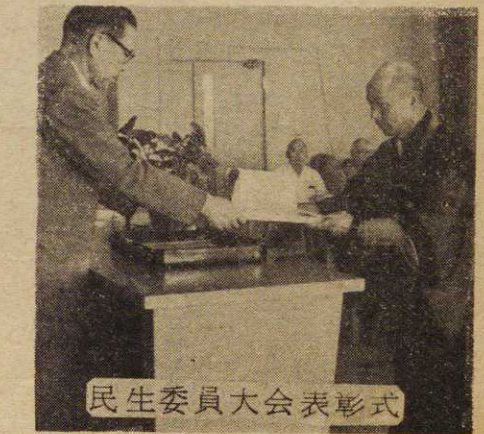
民生委員大会表彰式