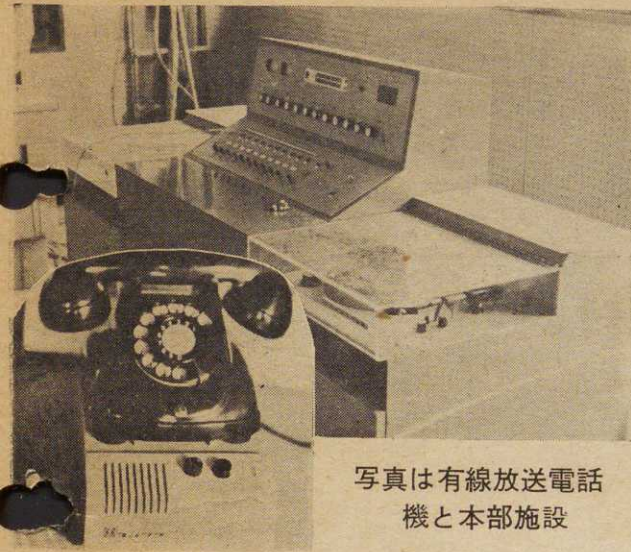
写真は有線放送電話機と本部施設

電話新設(公社分)のお知らせ 市長室(新設直通) 四一一〇 総務課(新設直通) 四一七五