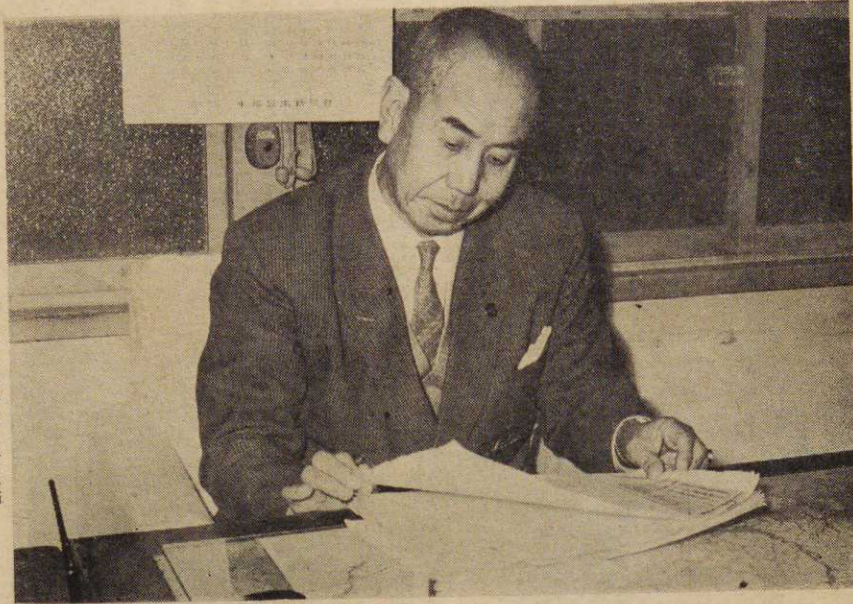
【写真は執務中の市長】

新産業都市にふさわしい、市道の整備拡充強化と平行して、一級国道と二級国道を結び完全路線の早期完成であります。