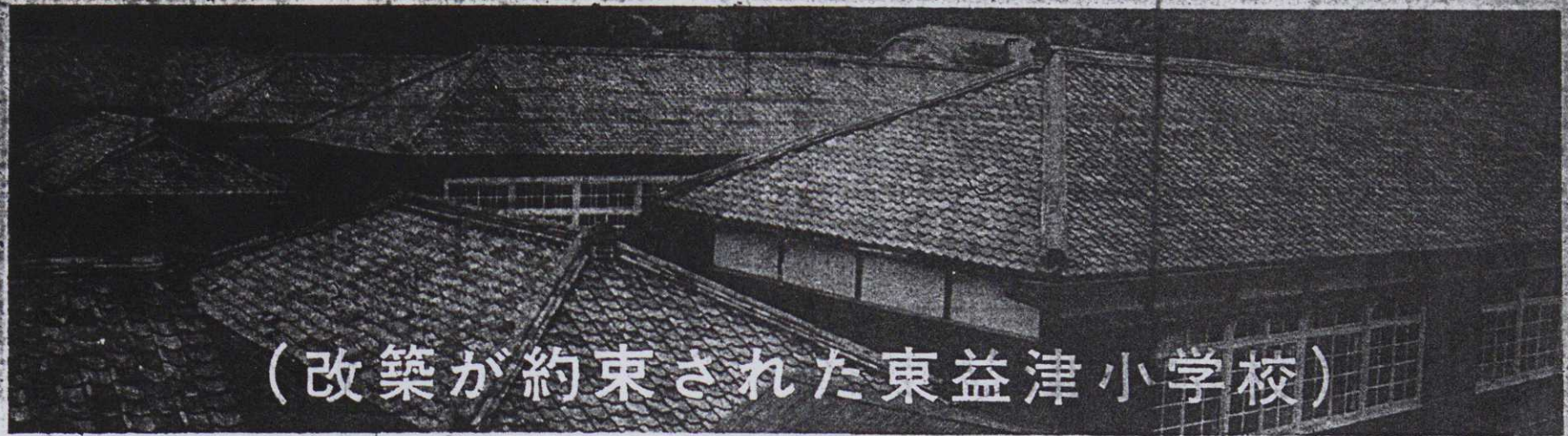
(改築が約束された東益津小学校)