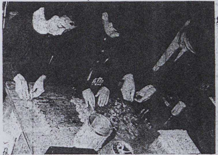
(市を訪れた大富小学校のよい子)

市立病院ではこのような事故の未然防止の意味で、もし火災が発生しても被害を最少限にとどめるように、十二月十四日の午後一時から、消防署の協力を得て防火訓練を実施いたしました。