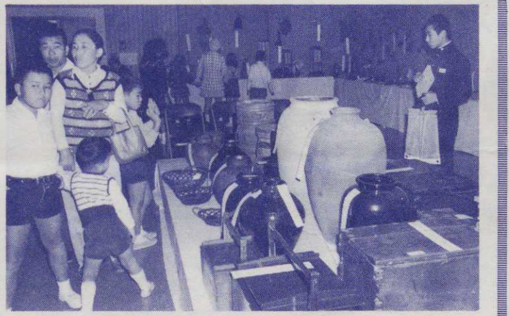
話題をよんだ『むかしの生活用具展』

避難場所 各地区の小中学校グラウンド、高校グラウンド、社会教育広場、公園など、近くの広場へ避難するように決めておきましょう。