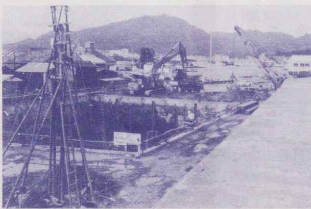
新屋ポンプ場 沈砂池を掘削中

十一月から無拠出制の福祉年金の額が月額三百円ずつ引き上げられ、つぎのようになりましした。 (種類) (改正後の年額) 老令福祉年金 三、六〇〇円 障害福祉年金 四、八〇〇円 母子福祉年金 四、八〇〇円 準母子 一、八〇〇円 また、今回の国民年金の法律改正で、つぎの点が有利になっています。心あたりの方は、保健課へ問い合 十一月から無拠出制の福祉年金の額が月額三百円ずつ引き上げられ、つぎのようになりましした。 わせ申し出てください。 公務扶助料をもらっている人にも福祉年金を全額支給 公務扶助料を受けているおとしよりは、この額が多いと、いままでは福祉年金がもらえない場合がありましたが、戦死した人が准尉以下であれば、福祉年金を全額支給(十月分から)されるようになります。