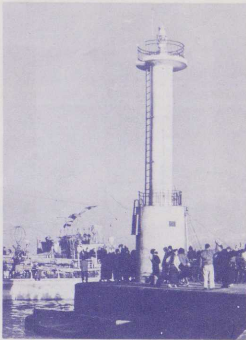
▲焼津港南防波堤、白灯台が竣工 (27年1月)