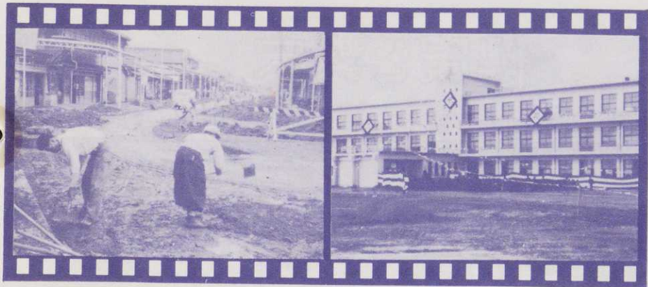
▲駅前通りの舗装を始める (33年9月)