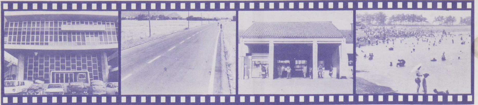
▲市民センターが竣工 (43年 4月)