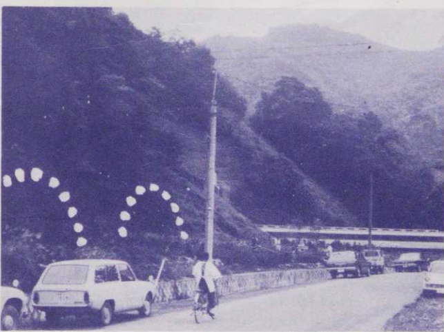
〔大崩バイパスの日本坂トンネルは新幹線の西側に作られる〕