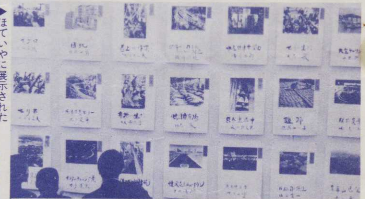
▶ほていやに展示された入選作品