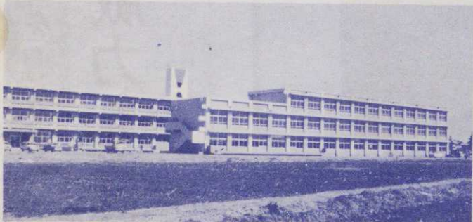
▲完成した港小学校の全景

こと (宅地や倉庫への通路橋等) ・河川の形を変えたり、植樹や伐採をすること ・汚水や廃液、抗水を河川に排水すること これらの事項に違反した場合には、罰則などがありますのでご注意ください。 また許可を受けていない人や、手続きの方法などについてはくわしく知りたい人は市役所都市計画課にお問い合わせください。 みなで 川をきれいに 使いましょう