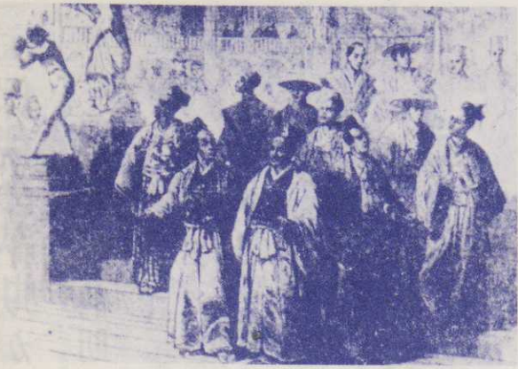
(文久2年 5月発行のイラストレーテッド・ロンドン・ニュースより)