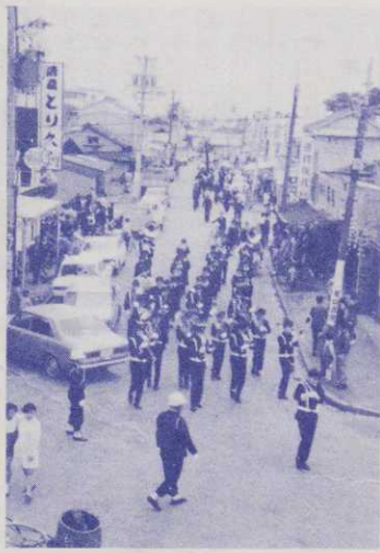
▲高校生の市中パレード

四月十七日、十八日の両日恒例の焼津みなと祭りが盛大に繰り広げられました。十七日は雨もパラッキあやぶまれましたが、午後には上がり、屋台のねり、踊りなどが見られました。 また十八日には、初鯉の福引き、市内の学校のブラバンド、水産物の加工品即売会など、また、他県の民俗芸能の市中披露等、各種の催しものとその見物で魚市場付近はたいへんにぎわいを見せました。