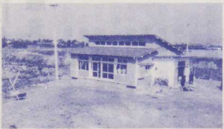
▶年間保育になった八桶の保育所

また八桶の季節保育所も、ことしから年間保育になり、四月十三日に開所式が行なわれました。この保育所は、昨年六月に農家を対象として作られ