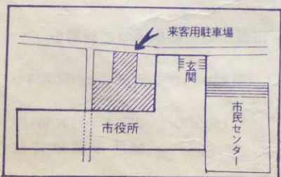
どうぞご利用ください。

こんどの駐車場増設は、清水銀行横の市役所駐車場と合わせて、市役所にこれら市役所の方の駐車場もやわらげられると思われま