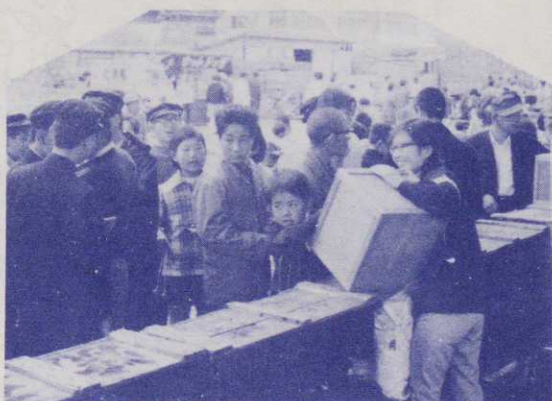
▶魚市場で行なわれた鯉の福引き