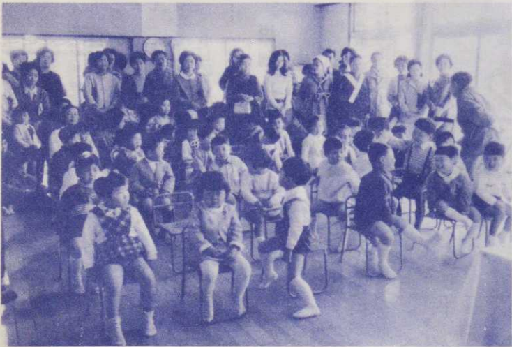
▲元気に開所式へ出席した八桶保育所の幼児たち

ともに職場に出て働かれています。そのため、保育に欠けるといふ家庭のために年間保育となりました。