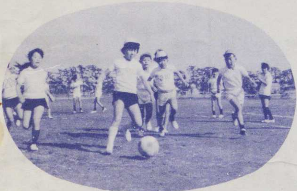
▲新しいグラウンドではりきる児童たち