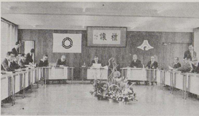
市議場で要望事項を聞く竹山県知事

①野山の価格安定策を国県で講じてほしい。 ②環境衛生関係 ③医療関係 ④観光関係