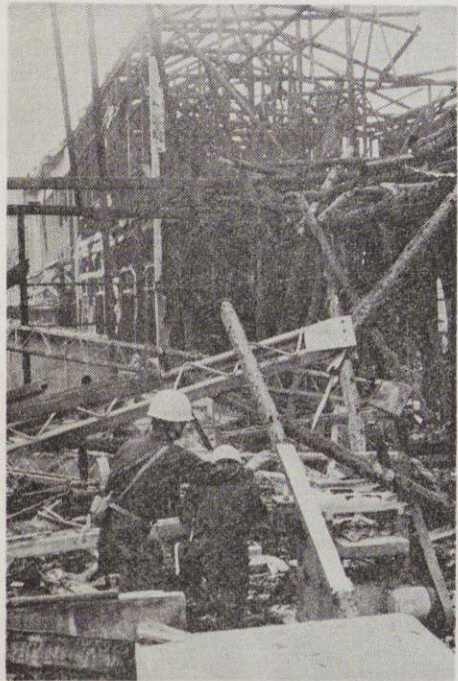
西半分を焼失した小川中の南校舎。この跡へ鉄筋コンクリート4階建ての校舎を建てます

市役所の正面玄関前に市民の待合室ができました。これは、とくに来客の多い住民課前のロビーが手せまなために設けられたものですが、これからの暑い日差しをさげ休息するのに、ちょうど良い場所と思います。買い物途中や待ち合わせなど休憩に、どうぞご利用ください。室内には、テレビ、新聞、雑誌のほか、市政資料も備えてあり、市役所の執務時間中、開いています。