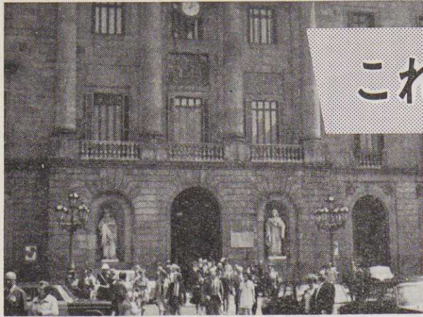
【バルセロナの市役所、もとはスペインの王城だった。】