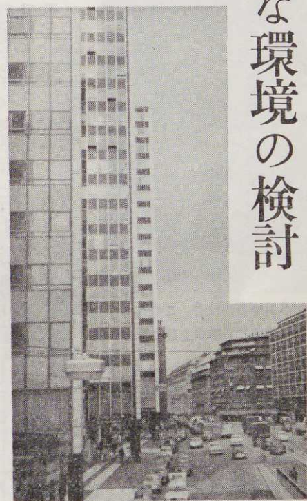
【理想的な計画都市キャンベラ】

ドレクターのスペイン国カ サノバ氏が主報告をし、 アツジャー氏から国連の活 動について一般的な説明が されました。