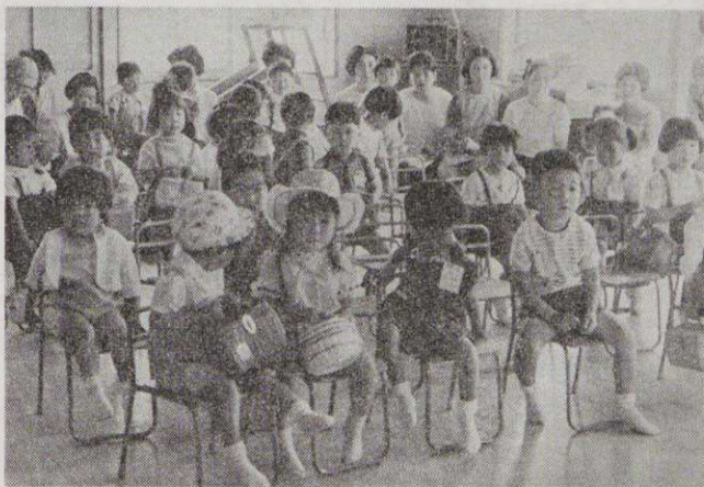
【元気な子どもたちの声で、にぎやかだった入所式】

全国でも初の協業組合による「デパート・スルガ」が、六月十日、駅前開店しました。昨年七月の「ほていや」の「ジャスコ」と、大型スーパーが進出し、市の商業界にも新しい時代の波が押し寄せてきました。このうした情勢に刺激されて市内の四商店が結集したもので、建設資金四億五千万円を投じて地上五階、地下一階のデパートとなり、地元の商店の新时代に對する試みとして、注目されています。