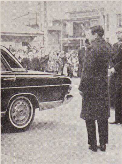
魚市場の前は老人たちや一般の市民でいっぱい。車からおりられた殿下は「万歳」の声に手を上げてお応えになった。