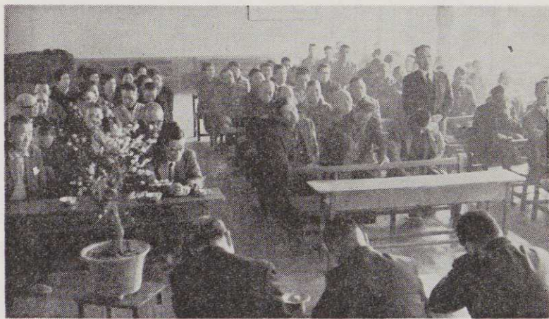
〔一日市会の皮切りは、2月17日、東益津小学校講堂で〕

現在、四十四年度当初予算をつくっています。前年度に比べると、一般会計(当初予算規模)で一二億円から一五億円に伸びると思われます。各地の要望については、大きなことは地元議員からきて予算編成に当たっていますが、さらに地元へ出て参りまして、直接、きめ細かいことをお聞きかせいただき、できる限り新年度事業に取り入れていきたいと考えています。個々のご要望や問題点のなかには、国の施策を待たなければならないものも