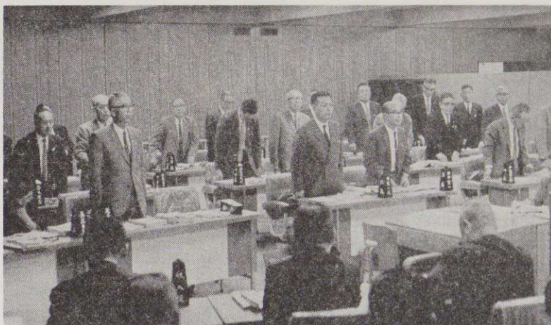
10月2日の本会議、議案の賛否は起立で採決された。

今回の補正は一般会計では二回のもので、才入出ともに一億四一八六百万円を追加し、補正後の累計は一億八千九百九十九万、かなり大型予算となる。 また、従来、商工費に組み込まれていた温泉関係予算を含めれば一億五億に近くなるわけである。 追加更正したもののうち金額の比較的大きいものを事業別にみると次のようになる。