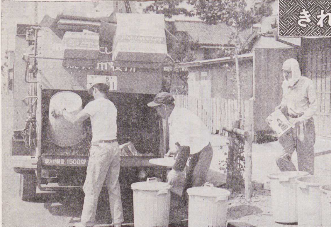
写真は、ゴミの収集作業。きれいにできれば、あともきれいな街に。

よつて、この目的達成のため、焼津市民の総意と責任のもとに、本市を「衛生都市」とすることを、ここに宣言する。