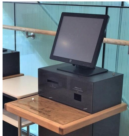
焼津・大井川図書館に 設置する自動貸出機