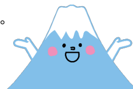
開館カレンダー（焼津図書館）